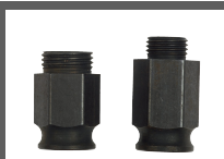
KIT DA 2 ADATTATORI CLIC