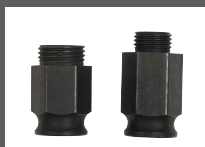
KIT DA 2 ADATTATORI CLIC