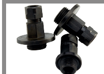
Set di 3 adattatori per seghe a tazza standard