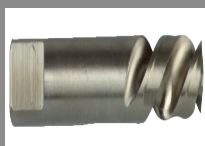
Punta di centraggio HSS per alberi BIZ 700 896 e BIZ 700 897