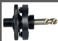
Albero per sega a tazza HSS bimetallo