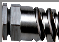
PUNTE DI CENTRAGGIO PER ALBERI SEGHE A TAZZA 8 % COBALTO