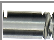
Punta di centraggio al cobalto per frese a tazza Clic II