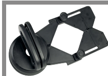
DIMA DI FORATURA