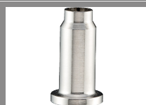
Diffuseur de chaleur pour fer à souder à gaz