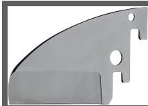
Ersatzklinge für rohrschneider biz 790 037