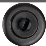
Kartelwiel voor buisensnijder