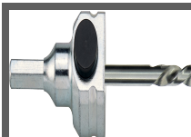
Arbres pour scies cloches Clic II