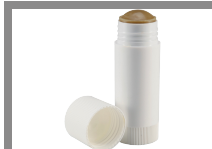
Pâte de coupe 30 g