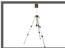
Driepoot voor 2850 307594