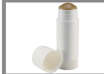
Pâte de coupe 30 g